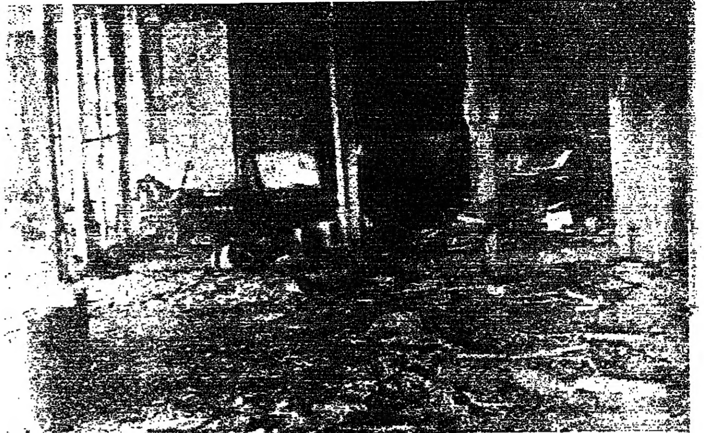
■ إحدى غرف الاستقبال في فندق « فينيسيا »